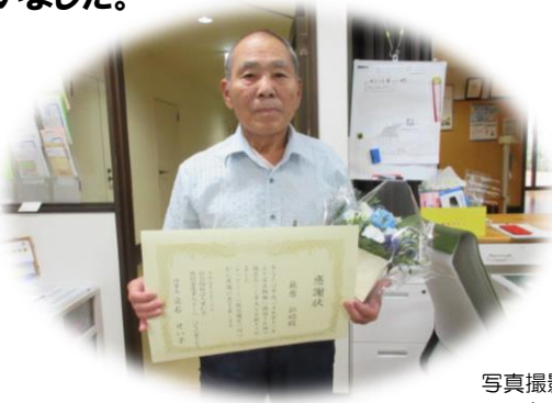
写真撮影の為、マスクを外して頂いています