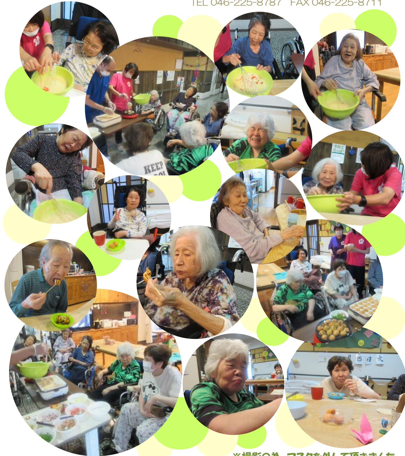
※撮影の為、マスクを外して頂きました

第42号 発行：2021年 7月 27日 特別養護老人ホーム はなの家とむろ 厚木市戸室5-9-15 TEL 046-225-8787 FAX 046-225-8711