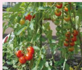
はなはな農園も楽しみです。