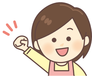
K 介護士・白波ユニット