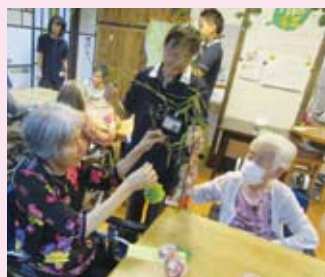
ユニットでのひとこま……