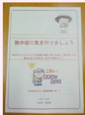
ご自由にお手にとってご覧ください!