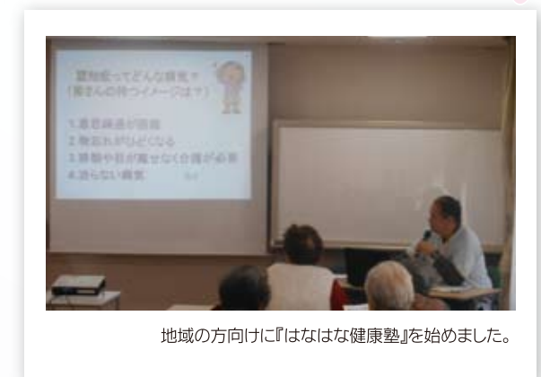
地域の方向けに『はなはな健康塾』を始めました。