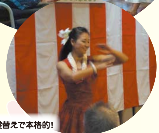
1曲1曲衣裳替えて本格的!