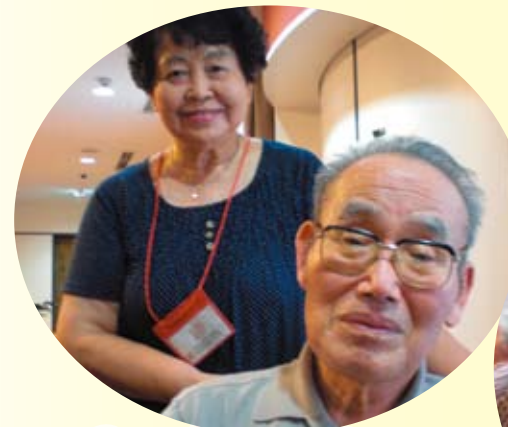
ご家族で参加くださった方も たくさんいらっしゃいました