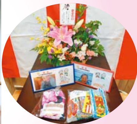
今年はおひとりおひとりに職員がメッセージをつけて写真立てをプレゼント!

神奈川県の高齢化率は全国で埼玉県、東京都についで第3位、厚木市も急速に高齢化が進み、昨年度の統計では高齢化率18.8%となりました。当施設の75歳以上の方は88名中80名です。「はなの家とむろ」では去る9月15日に敬老祝賀会を開催し、入居者様を子ども達のフラダンスで祝福いたしました。