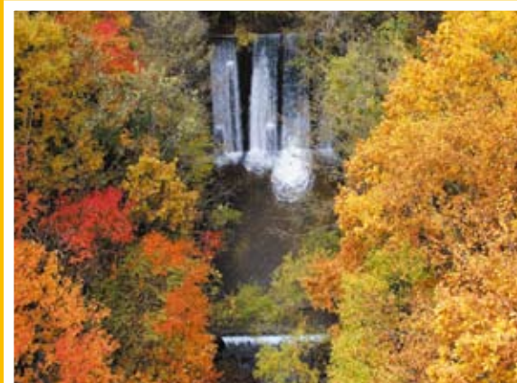
「秋彩の息吹」長野県木曾福島開田高原

厚木市在住の写真愛好家サークル「フォトサークルA」の皆様より定期的に季節感あふれる写真を施設内に飾っていただいています。立ち寄られた際にはぜひご覧ください!