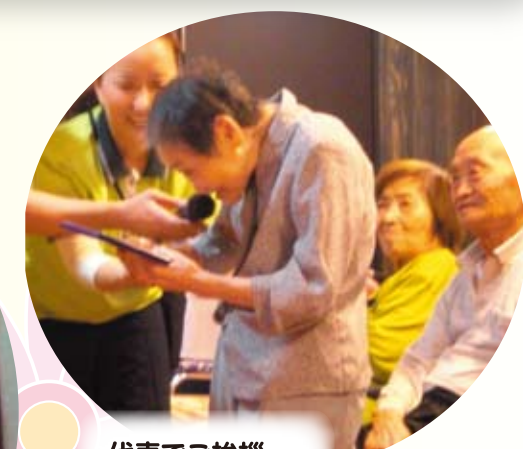
代表でご挨拶 少し緊張気味・・・