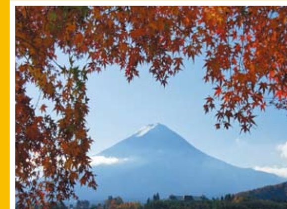
「晩秋の華」山梨県河口湖畔

暑さが過ぎればこれからは楓(もみじ)が色づきはじめ美しい季節になります。自然の風景、植物の姿、空の色などはその季節の移り変わりを映す鏡のようなものです。ぜひ皆さんも日本の四季を堪能してください。