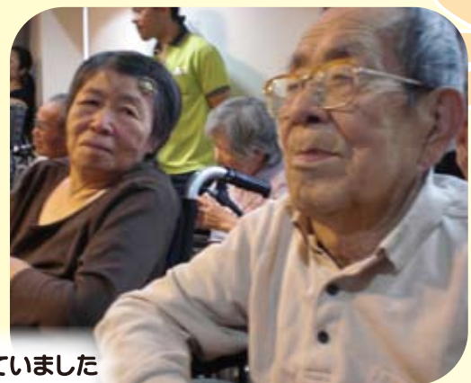
みなさん熱心に観賞されていました 一緒に踊っている方も・・・!!