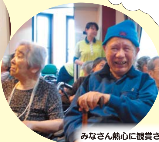
みんな かわいいね～!