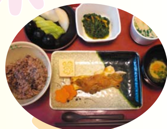
メイン料理は白身魚の葱味噌焼きと お赤飯でお祝い