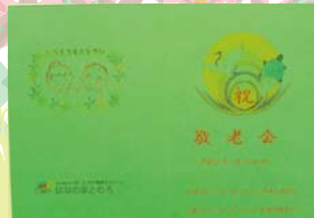
◆当日お配りしたお祝いのカードです。